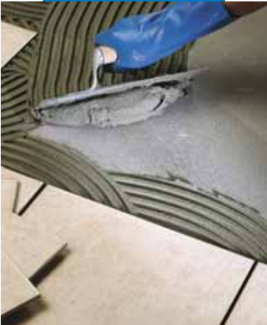
Egyszer égetett burkolólap ragasztása padlóra

A hő- vagy hangszigetelő panelek ragasztásához az Adesilex P9 -et fogazott simítóval hordja fel.