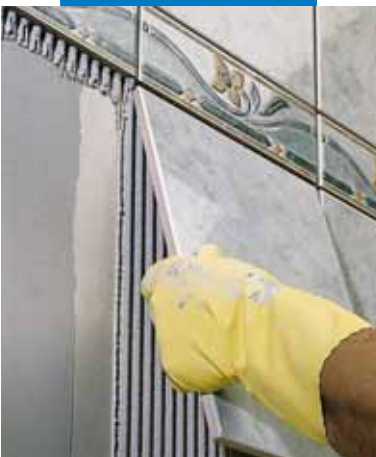
Egyszer égetett burkolólap ragasztása vakolt falra