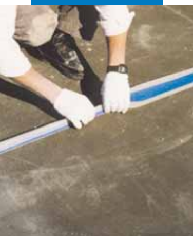
Példa terasz osztóhézagának tömitésére