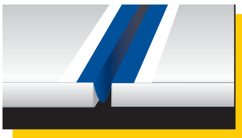
Mapeband Ω formában történő elhelyezése tárgulási hézagban