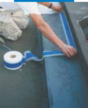
Példa fürdőmedence függőleges és vízszintes felületének csatlakozásánál lévő él Mapeband-dal történő vízszigetelésére